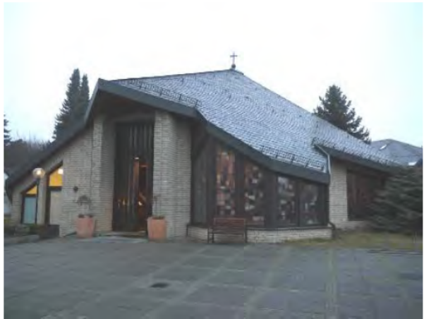
Kirche „Mariä Himmelfahrt“