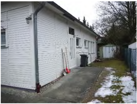
Gemeindehaus „St. Franziskus von Assisi“

Der Immobilienbestand und seine Bewertung