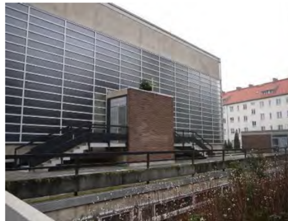
Kirche „St. Wilhelm“