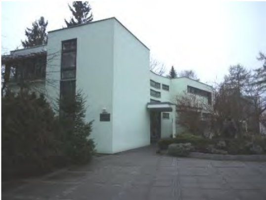
Pfarrhaus „St. Mariä Himmelfahrt“

Der Immobilienbestand und seine Bewertung