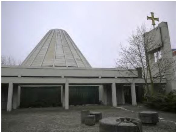
Kirche „St. Markus“