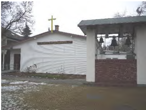
Kirche „St. Franziskus von Assisi“

Der Immobilienbestand und seine Bewertung