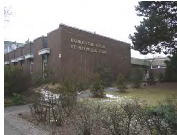
Gemeindezentrum „St. Maximilian Kolbe“