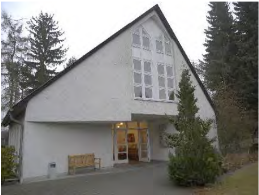
Gemeindehaus „St. Mariä Himmelfahrt

Der Immobilienbestand und seine Bewertung