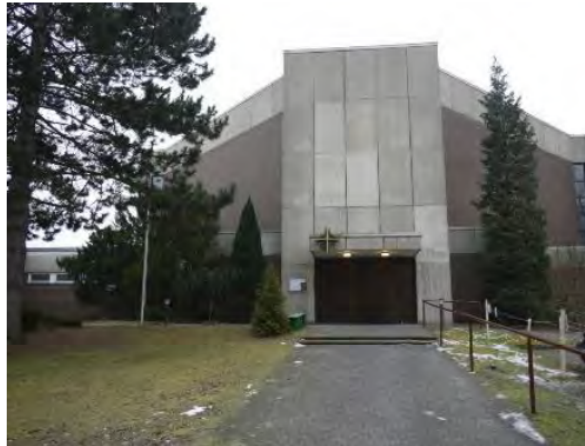
Kirche „St. Maximilian Kolbe“