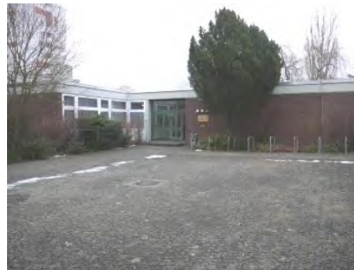
Gemeindezentrum „St. Markus“