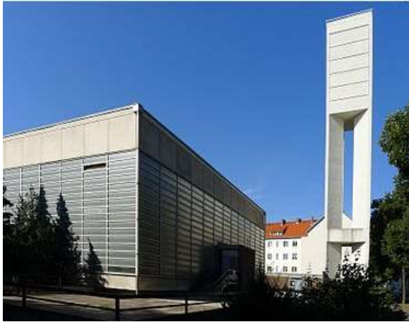
St. Wilhelm, Berlin