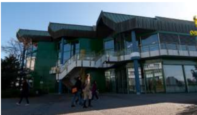
Zentralbibliothek der Universität, Trier