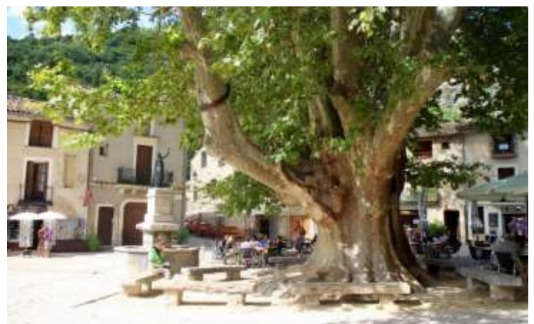
Der gemütliche Dorfplatz von Saint Guillem-le-Désert