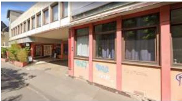
Berufsschule Deutschherrenstraße, Trier