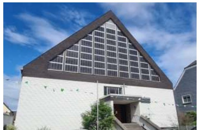
Katholische Kirche St. Peter und Paul, Mülheim-Kärlich